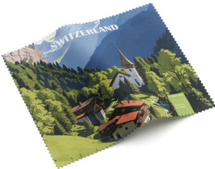
Ansicht des fertigen Brillentuchs